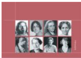
HANDBUCH DER ÖSTERREICHISCHEN KINDER- UND JUGENDBUCHAUTORINNEN BAND 1: A-L