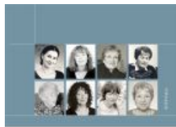
HANDBUCH DER ÖSTERREICHISCHEN KINDER- UND JUGENDBUCHAUTORINNEN BAND 2: M-Z